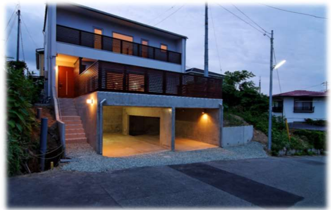
H26年度 住宅のゼロエネルギー化推進事業採択

太陽光発電システム: CIS太陽電池 4.08kW 熱損失係数Q値: 0.83W/㎡・K 外皮平均熱貫流率UA値: 0.33W/(㎡・K)