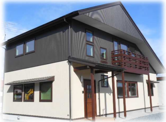
H25年度 ネットゼロエネルギー住宅支援事業採択

太陽光発電システム: CIS太陽電池 4.08kW 熱損失係数Q値: 0.83W/m 2 ・K