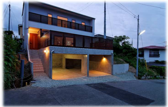
H26年度 住宅のゼロエネルギー化推進事業採択

太陽光発電システム: CIS太陽電池 4.08kW 熱損失係数Q値: 0.83W/m 2 ・K